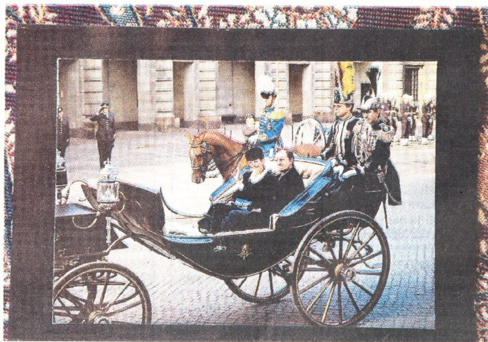
Till höger om kungaparets vagn, strax bakom hjulet är hovstallmästarens plats. Där har han uppsikt över ekipaget.

– Vi borde ha behållit värnpliktsförsvaret. Det var bra för landet och betydelsefullt för integrationen. Vi borde ha hållit oss borta